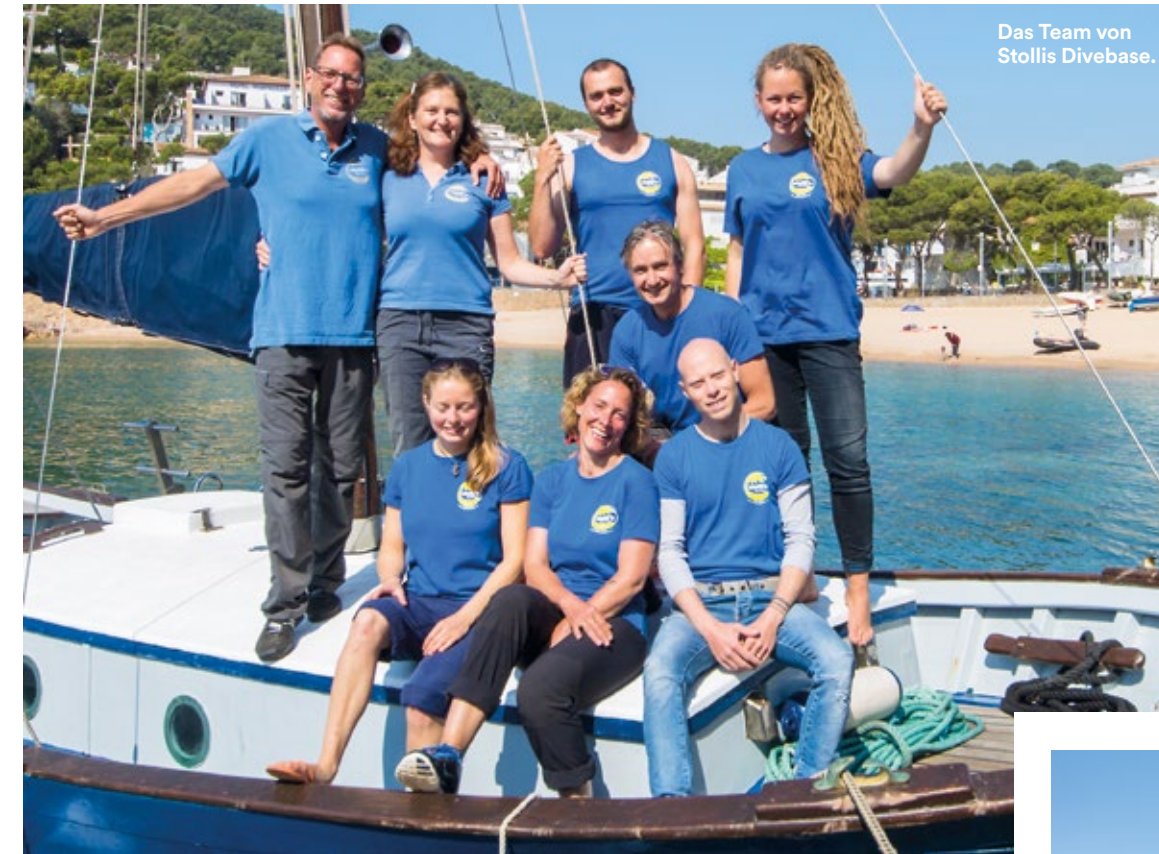
Das Team von Stollis Divebase.