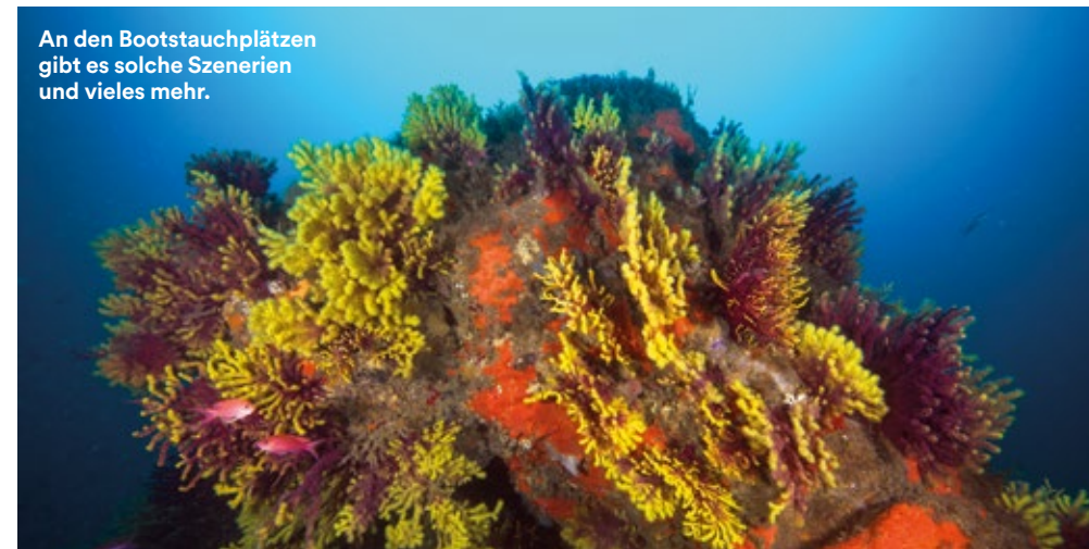
An den Bootstauchplätzen gibt es solche Szenarien und vieles mehr.

Ihr Tauchrevier kann sich sehen lassen, und das beginnt schon mit dem hervorragenden Hausriff. Es ist vielfältig, sehr groß, mit nischenreichen Felsarealen, Sandgründen, Seegraswiesen und zum Buchtausgang hin Freiwasser – ein spannendes, abwechslungsreiches Revier. Es verbindet denkbar unkompliziertes Tauchen mit einer außergewöhnlichen Artenvielfalt. Zu dem, was man